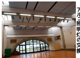
アル照明灯の交換