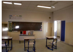
中学部教室天井を張替！