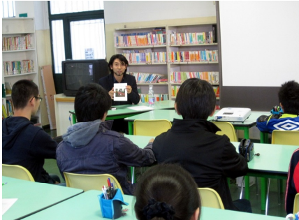
目を輝かせて聞き入る中学生

【五つのしおり】 気持ちのよいあいさつをします。 はっきり伝え合う言葉づかいをします。 身の回りをきれいにします。 時間を守ります。 自分の役割を果たします。