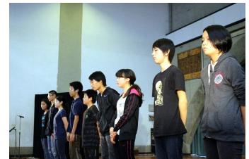
学習発表会をプロデュースした中学生諸君

各ご家庭におかれましても、自分の将来を意識し始めた我が子への励ましの声かけと最大限のご支援をよろしくお願ひします。