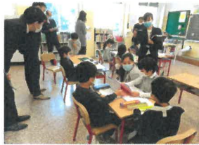
小学生の授業をみる先生方

放課後の研修会では、算数の授業だけでなく、小中9年間を見通した授業づくりについてなど、活発な意見交換を行いました。このように自分の授業をお互い見せ合うという習慣が他国ではないため、現在、世界各地で注目されている研修スタイルという事です。日本の教育水準の高さを維持しているのは、この研修スタイルに要因があるのかも知れません。