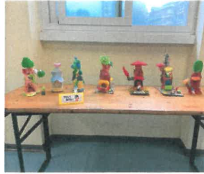
小5年生の図工作品

この時期に、読書や趣味、体力づくりの時間を充実させたり、you tubeで勉強したり、家の周りをランニングしたりするなど、家庭での時間を有効活用しましょう。