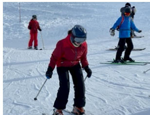
滑れるようになったよ