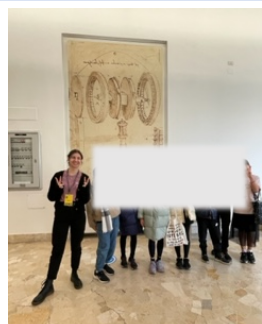
小5 ダヴィンチ博物館見学

☆先日、施設安全対策会議が開かれ、産業医の方と安全衛生管理主任の方と校内を巡回し、日本人学校の点検を行いました。来年度は、技術科室、家庭科室の改修工事を検討しています。