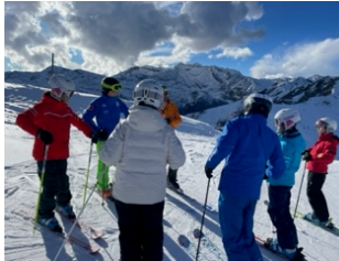
スキー講習の様子

☆先日、施設安全対策会議が開かれ、産業医の方と安全衛生管理主任の方と校内を巡回し、日本人学校の点検を行いました。来年度は、技術科室、家庭科室の改修工事を検討しています。