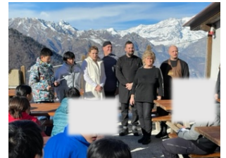
お世話になった宿の皆さん

や、トランプをしたり、卓球をしたりして友達と一緒に2泊3日を楽しんでいました。友達と一緒に宿で過ごす時間は子どもたちにとってとても楽しい思い出になりました。 来年もぜひ充実した体験学習になるよう願っています。