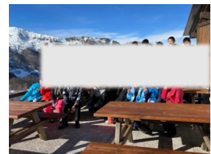
モンテローザをバックに