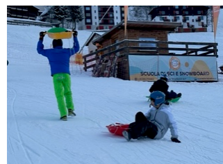
そり遊びを楽しむ