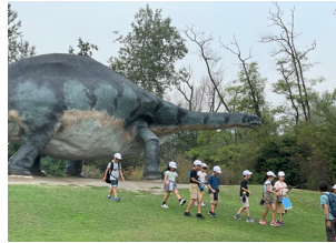
大きな恐竜がたくさん

9月7日に、小学1年生～4年生が恐竜公園になかよし遠足に行ってきました。今回の遠足では、4年生がリーダーになり、たてわり班活動を行いました。4年生はこれまでの仲よし集会や出発式、解散式、グループの班長・副班長など、重要な役割を担うことによつて、自主性やリーダー性を育てるいい機会になったと思います。ぜひ、下級生に優しく接する良いリーダーに育ってほしいと願っています。これからの4年生の頑張りに期待しています。