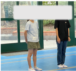
中2、小5に転入生がきました

☆イタリア教育省の発表を受け、12日から本校の感染症対策が新しくなります。本日配布したプリントをお読みください。 ☆校庭開放などでネズミ駆除のための餌(黒いボックス)を見かけても絶対に触らないようお願いいたします。