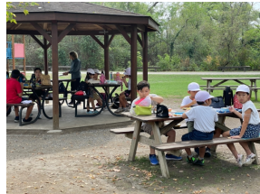
グループごとに昼食をとりました