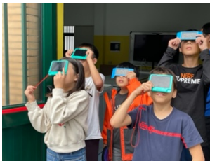
日食の観察をする子供たち

☆三日から暖房が入りました。光熱費が高騰しているため、最低限必要な暖かさで設定しています。 ☆二十五日に日食がありました。子供たちが遮光板を使い観察しました。