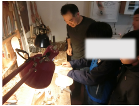
工房で木を削る6年生