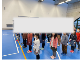
後期後半開始の全校集会

後期後半は9週間ですが、「『9週間しかない。』と考えるのではなく、『9週間もある。』と考える、前向きに取り組みましょう。」と全校集会で後期後半に向けての心構えを話しました。子どもたちの頑張りには期待しています。