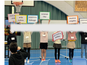
日本語を教える子供たち