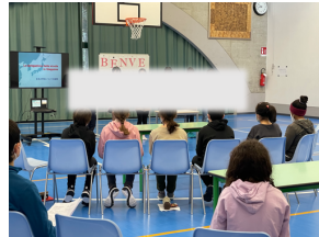
笛の合奏でお出迎え

10日に、小学部5・6年生がスクローサーティ校の子ともたちと本校で交流会を行いました。将来になりたい職業を交えた自己紹介では、ジェスチャーでやりたい職業を表現し、答えてもらいました。おだやかな雰囲気の中で、ゲームをしたり、日本の行事を教えたりと楽しく交流していました。