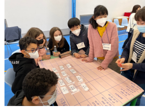
一緒にゲームを楽しむ